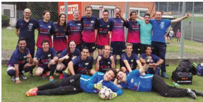
FCZ BRUNAU in Trübbach, September 2016

Der FCZ Brunau kann stolz auf sich sein. Es war das erfolgreichste Jahr seit 20 Jahren. Der FCZ Brunau hat mit der ersten Mannschaft alle Turniere gewonnen und die zweite Mannschaft hat sich von ihrer besten Seite gezeigt und eine Topleistung geboten. Ein starker innerer Zusammenhalt, Teamgeist und gegenseitiger Respekt ist den Mannschaftsmitgliedern wichtig.